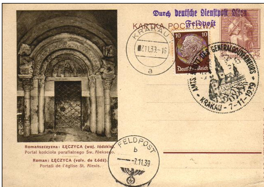
S1 dated 07.11.1939 on Polish postal stationery. The regulation was to affix valid stamps of the Reich. Polish postal stationery could be used, but only as a postal formulary and had no postal validity.