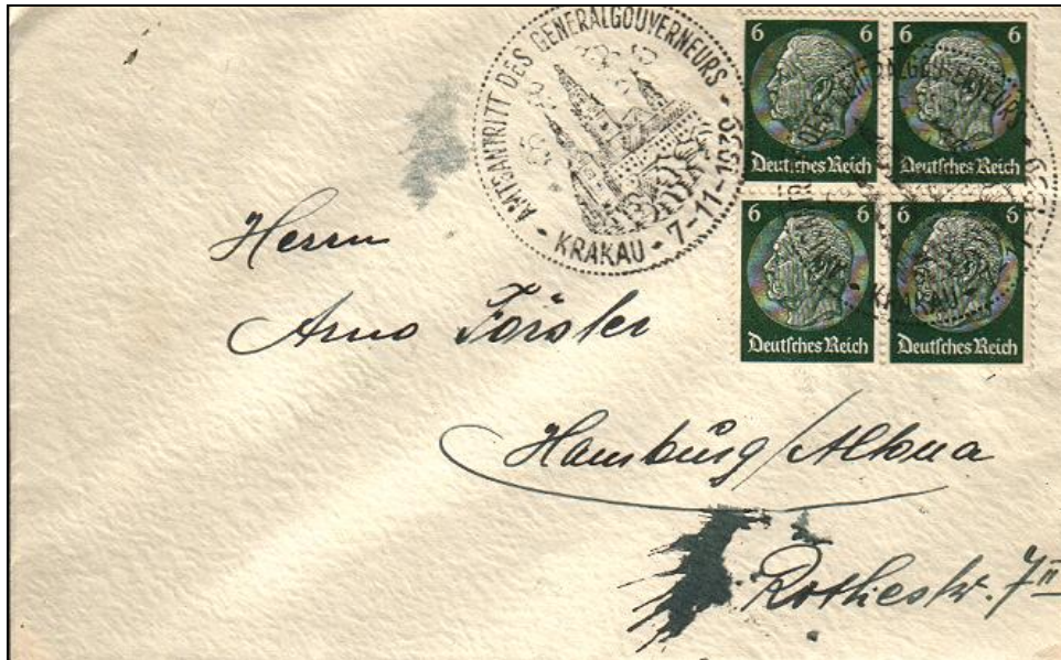
S1 on letter (2 nd Postal Rate) from Krakow, with 4x GR Mi# 516 – correct rate for letter.