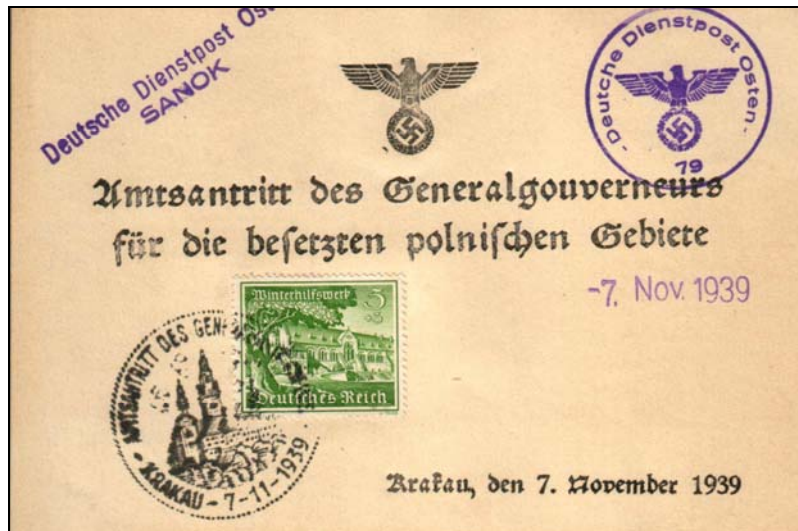
Souvenir card with Deutsche Dienstpost Osten (DDPO) security cancel number 79 – Sanok – and datestamp 07 November 1939.

This souvenir card was cancelled after 07.11.39! The release of this card was officially published in the Warschauer Zeitung dated 26/27.11.1939 and announced with the Official Bulletin RPM dated 01.12.1939.