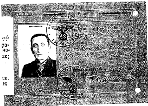
Vorderseite eines Dienstausweises für Polen, der im Dienst der Deutschen Reichsbahn stand.